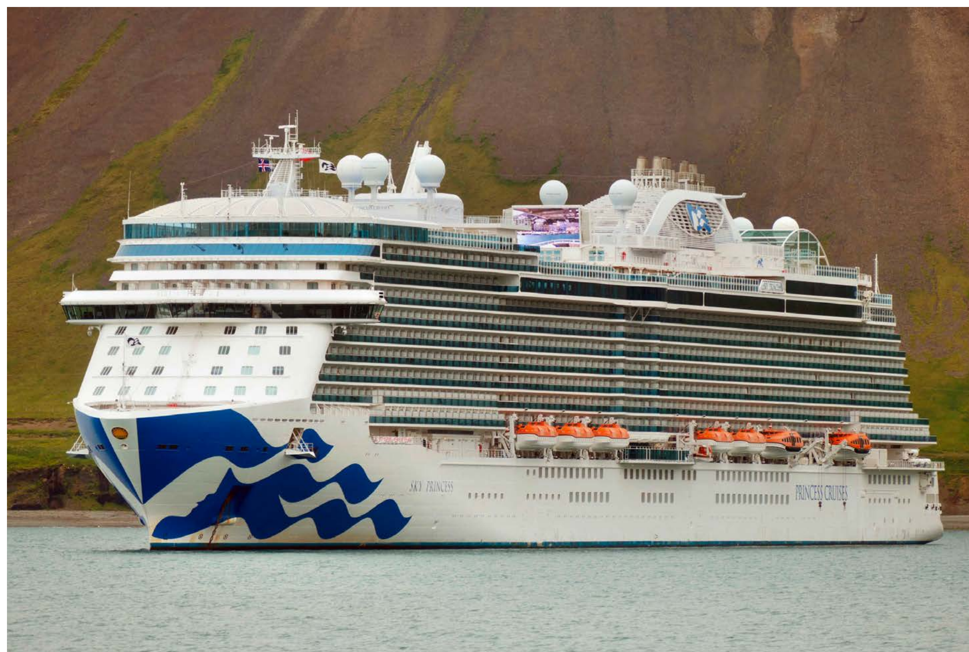
Die SKY PRINCESS ankerte am 4. Juli 2022 in einem Fjord nördlich von Reykjavik.