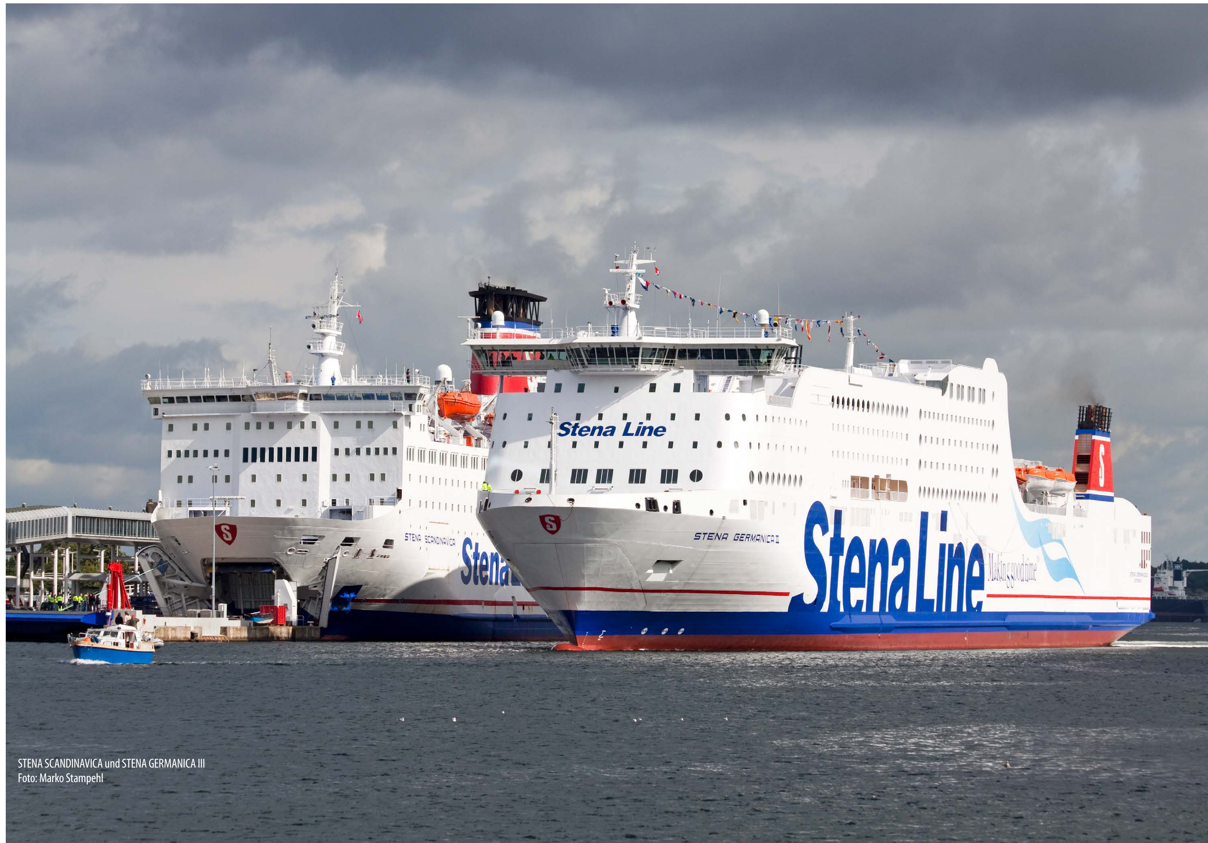
STENA SCANDINAVICA und STENA GERMANICA III