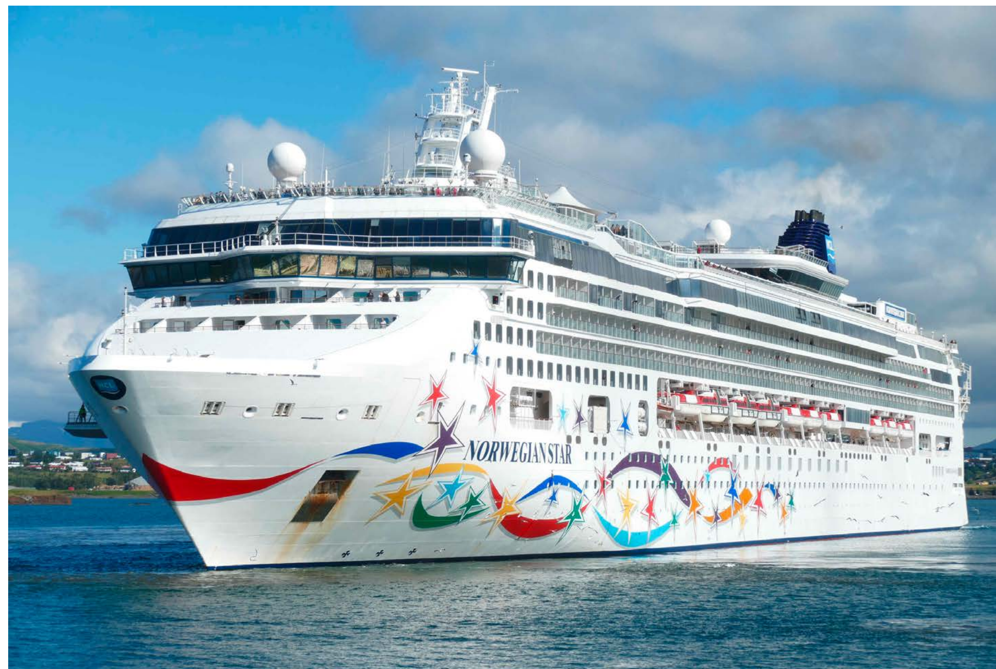
Mit dem Foto der NORWEGIAN STAR startete am 14. Juli der Stadtrundgang durch Reykjavik.