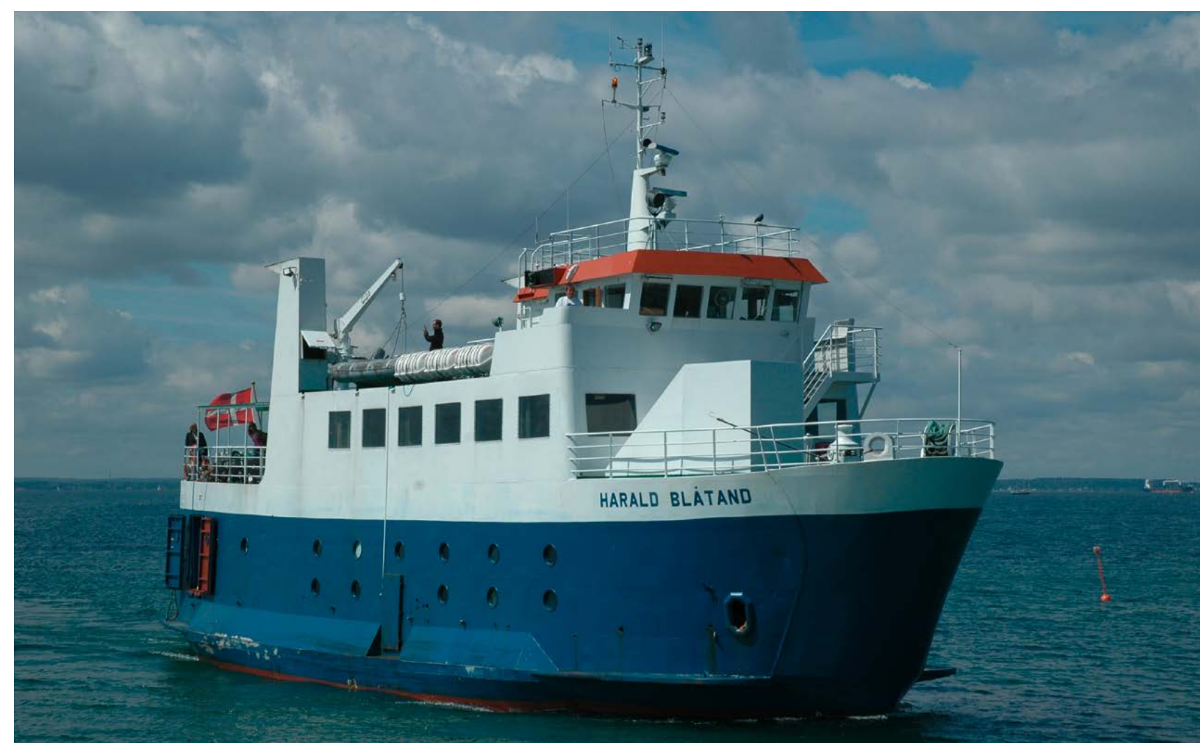
Im Juli 2005 war die HARALD BLÅTAND noch zu Ausflugsfahrten im Øresund unterwegs.