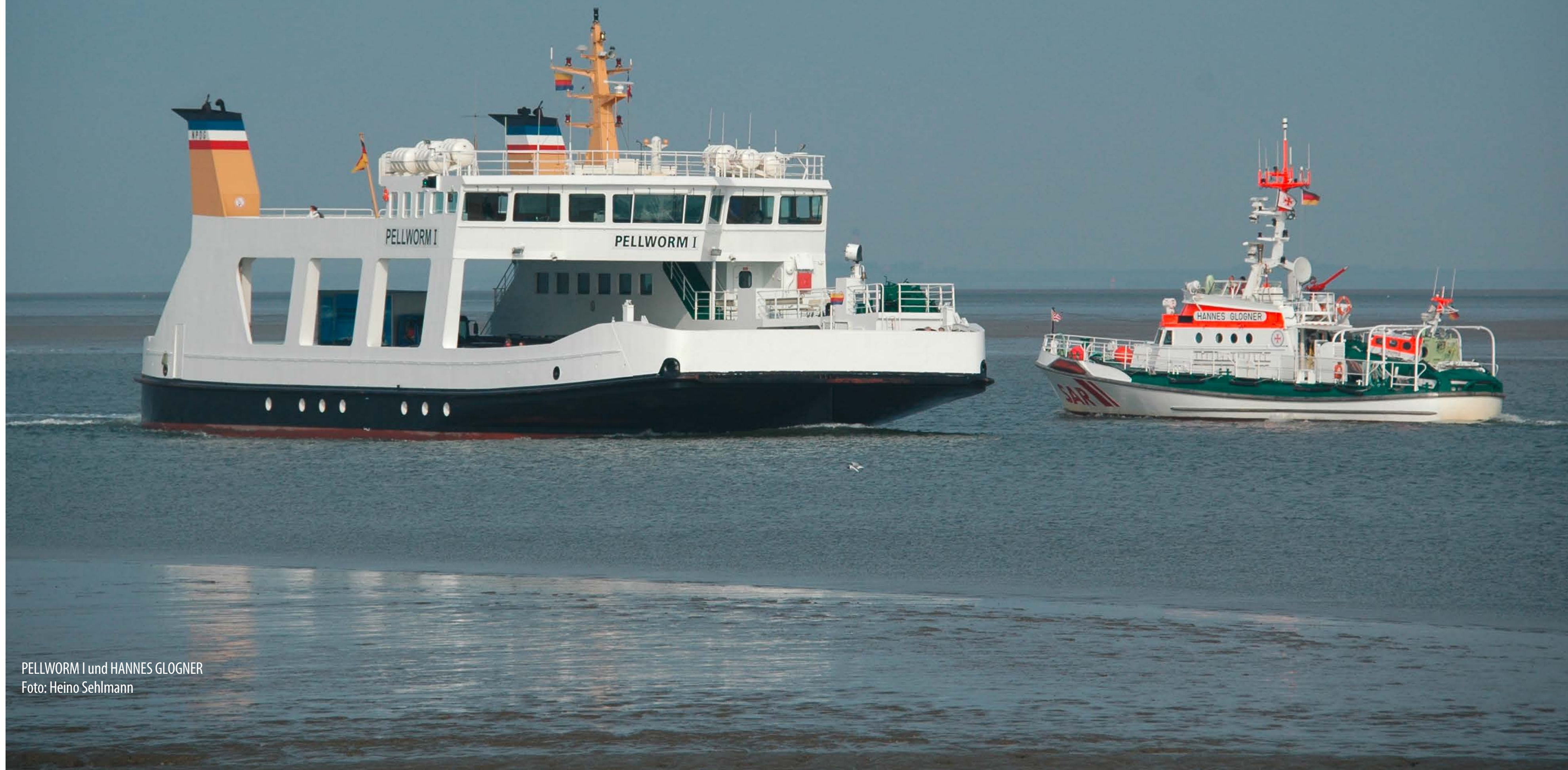
PELLWORM I und HANNES GLOGNER

So wurden auch für die Rückschau auf die „Zweitplatzierten“ für das Jahr 2014 nur Fahren als Hauptmotiv für diese drei Seiten ausgewählt.