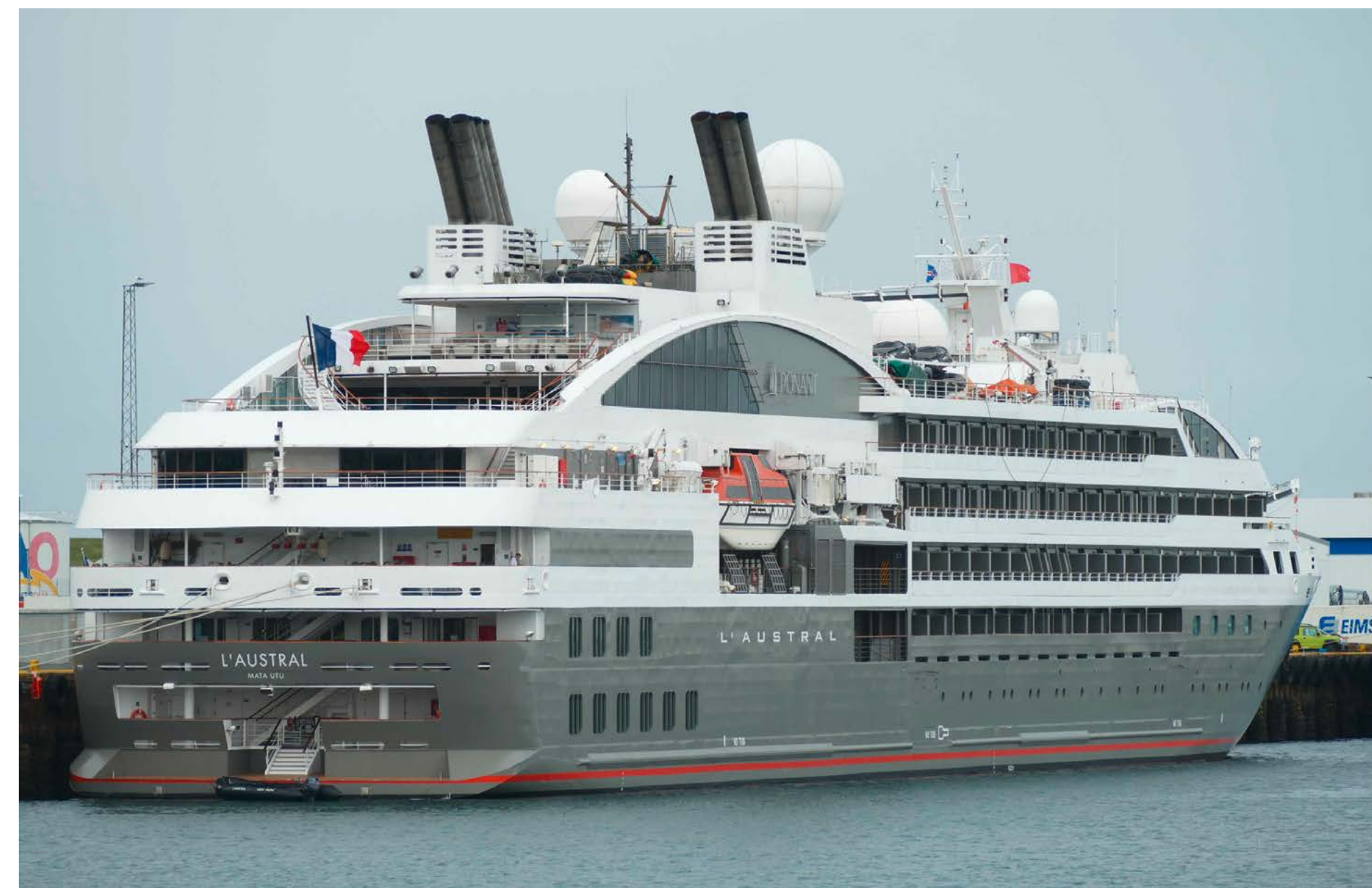
Die L' AUSTRAL begegnete uns am 15. Juli in Hafnarfjörður