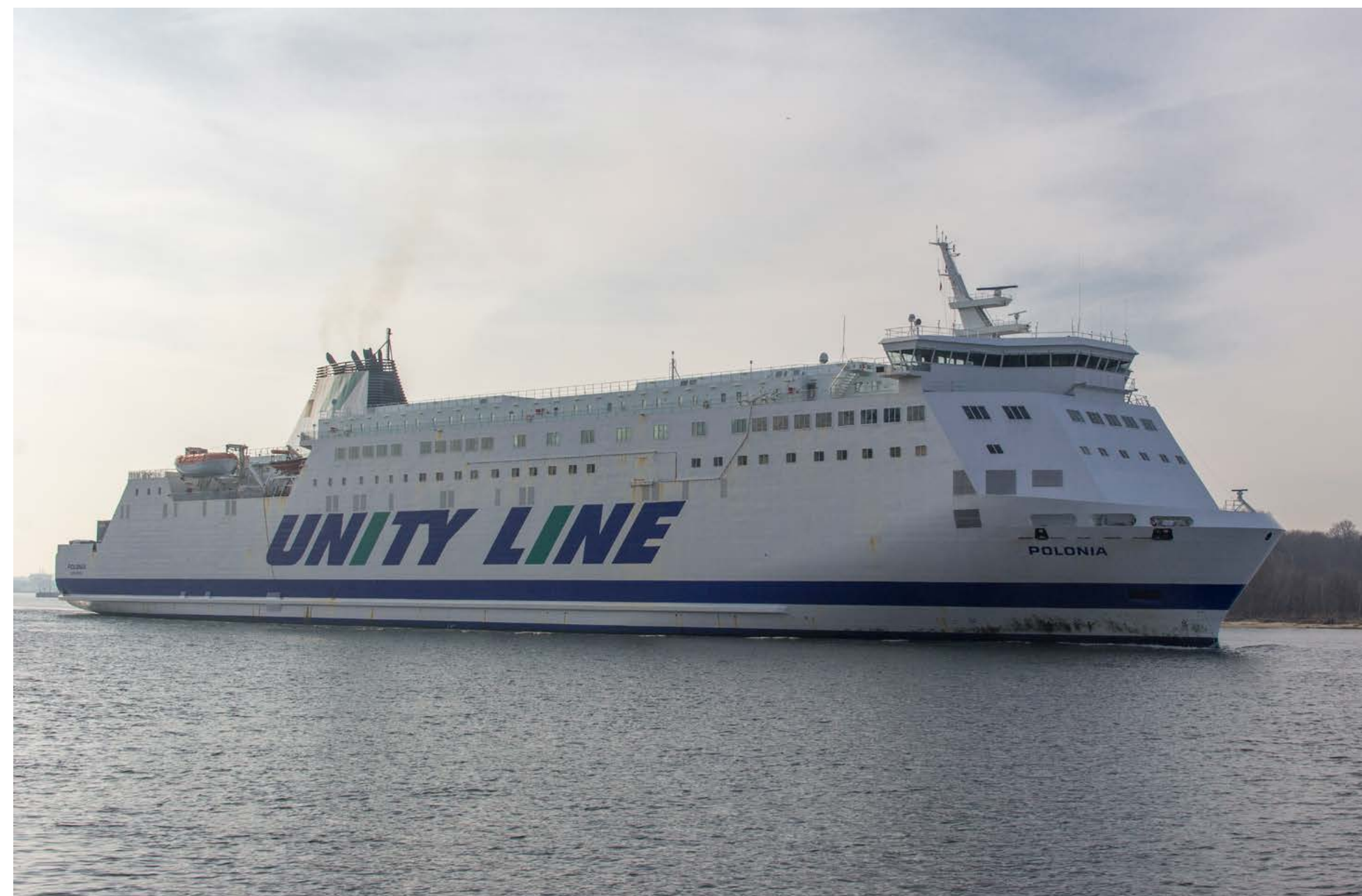
Nur eine halbe Stunde vor der CRACOVIA macht sich die POLONIA täglich auf den Weg von Świnoujście nach Ystad.