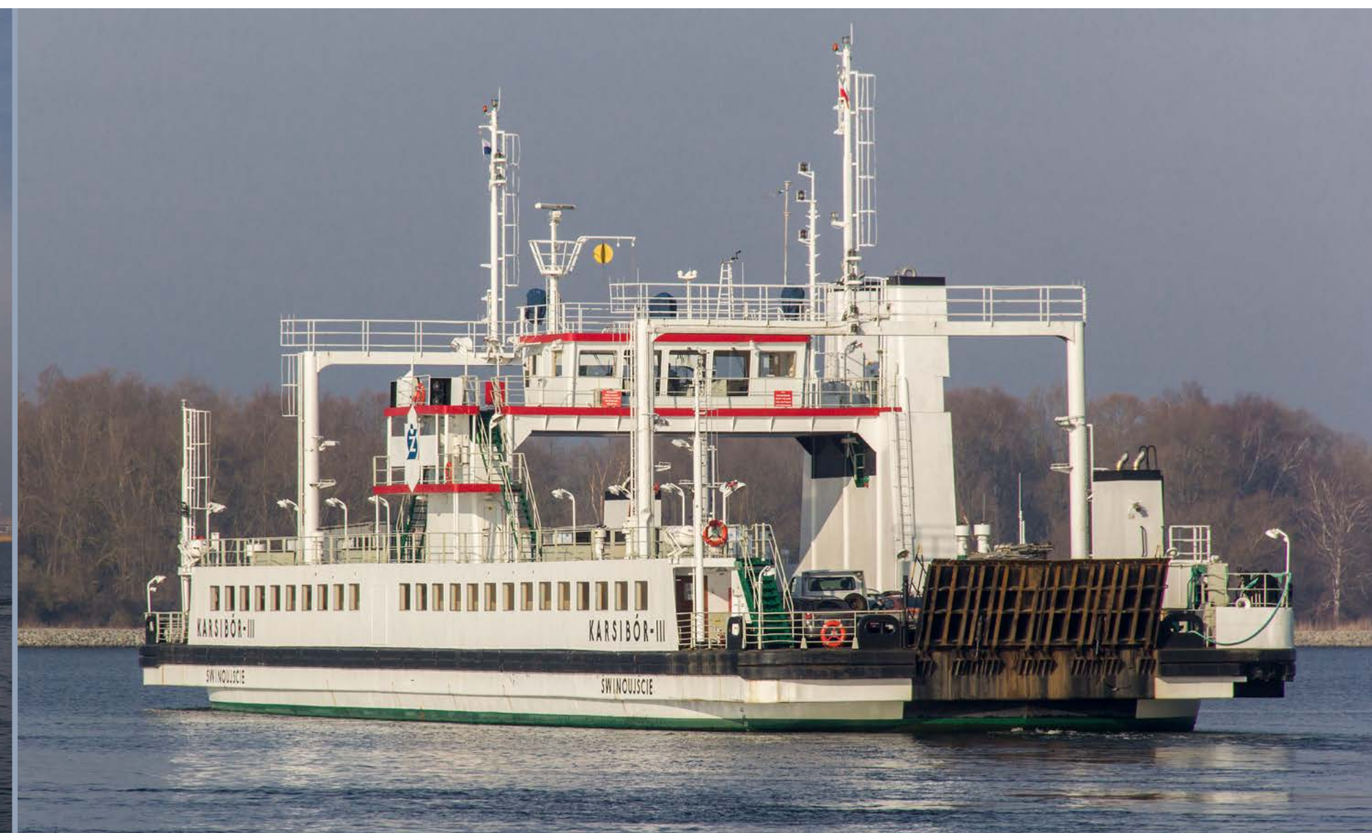
In wenigen Wochen wird der Swinetunnel eröffnet. Dann ist die Zeit für die Fährverbindung zwischen Usedom und Wolin südlich von Swinemünde wohl abgelaufen. Am 19. Februar 2023 waren die KARSIBÓR I und KARSIBÓR III noch im Einsatz, KARSIBÓR IV lag als Reservefähre auf. Pendler werden der Tunnelöffnung sehnsüchtig entgegenfeiern, dauert eine Überfahrt mit Verladung doch gut 30 Minuten, Wartezeit nicht mitgerechnet.