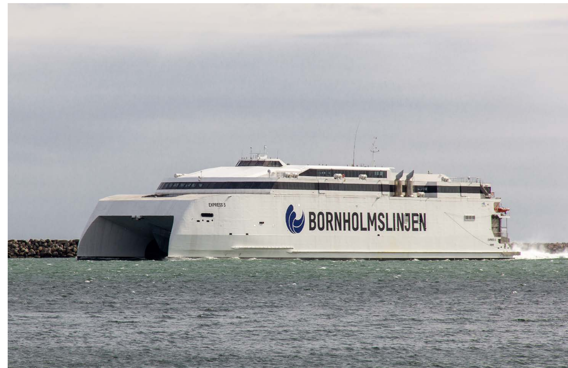
EXPRESS 5, der jüngste Katamaran von Bornholmslinjen, erreicht am 5. Mai 2023 Ystad.