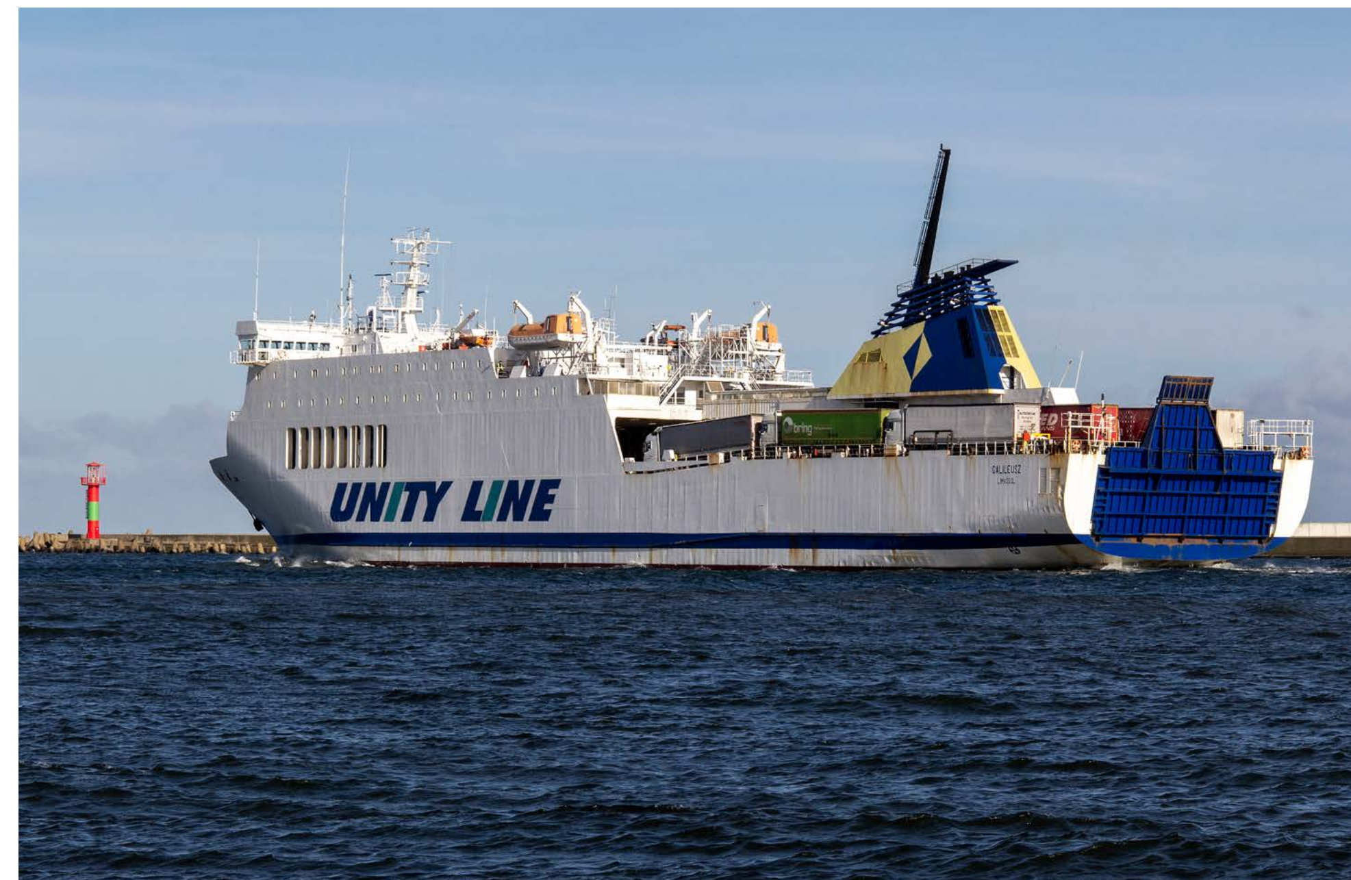
Die GALILEUSZ befördert zwischen Świnoujście und Trelleborg ausschließlich Fracht.