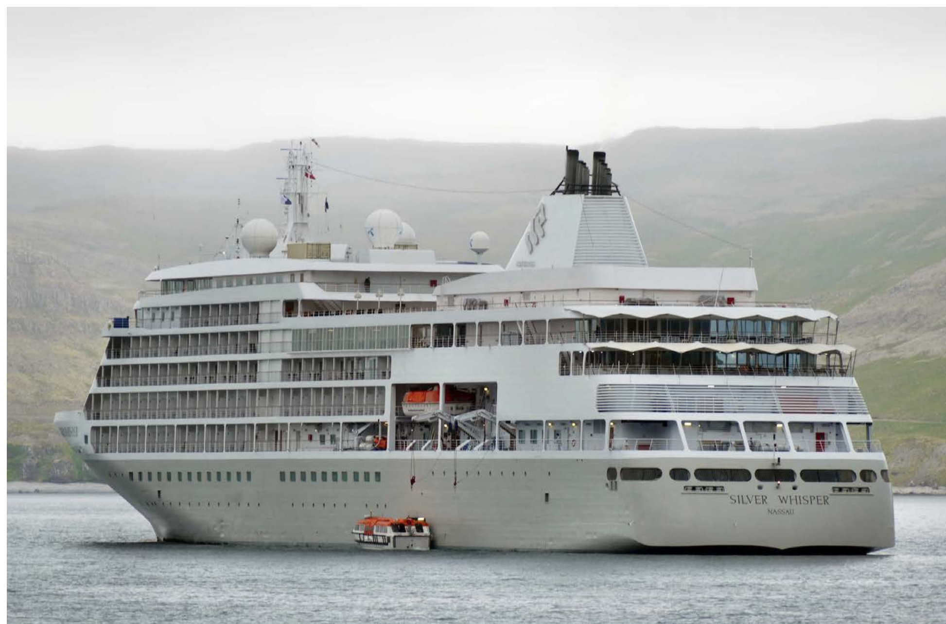
Trotz Regenwetters wurde die SILVER WHISPER am 5. Juli 2022 während der Rundreise entlang der Westfjorde festgehalten.

Gerne wollte ich meine Erinnerungen an meinen ersten und bis dato einzigen Island-Aufenthalt während einer Kreuzfahrt mit der MAXIM GORKI im Sommer 1993 auffrischen und intensivieren. Noch heute erinnere ich mich an den bescheidenen norddeutschen Sommer in jenem Jahr und das deutlich bessere Wetter in Reykjavik und Akureyri.