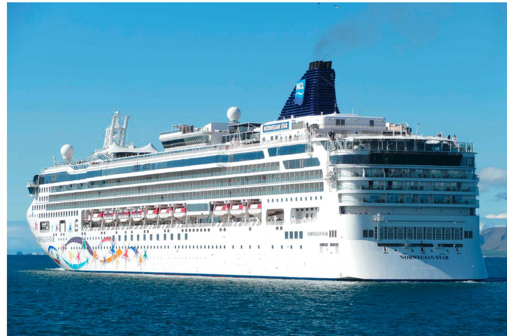
Das Auslaufen der NORWEGIAN STAR war der Schlusspunkt der Exkursion durch die isländische Hauptstadt.