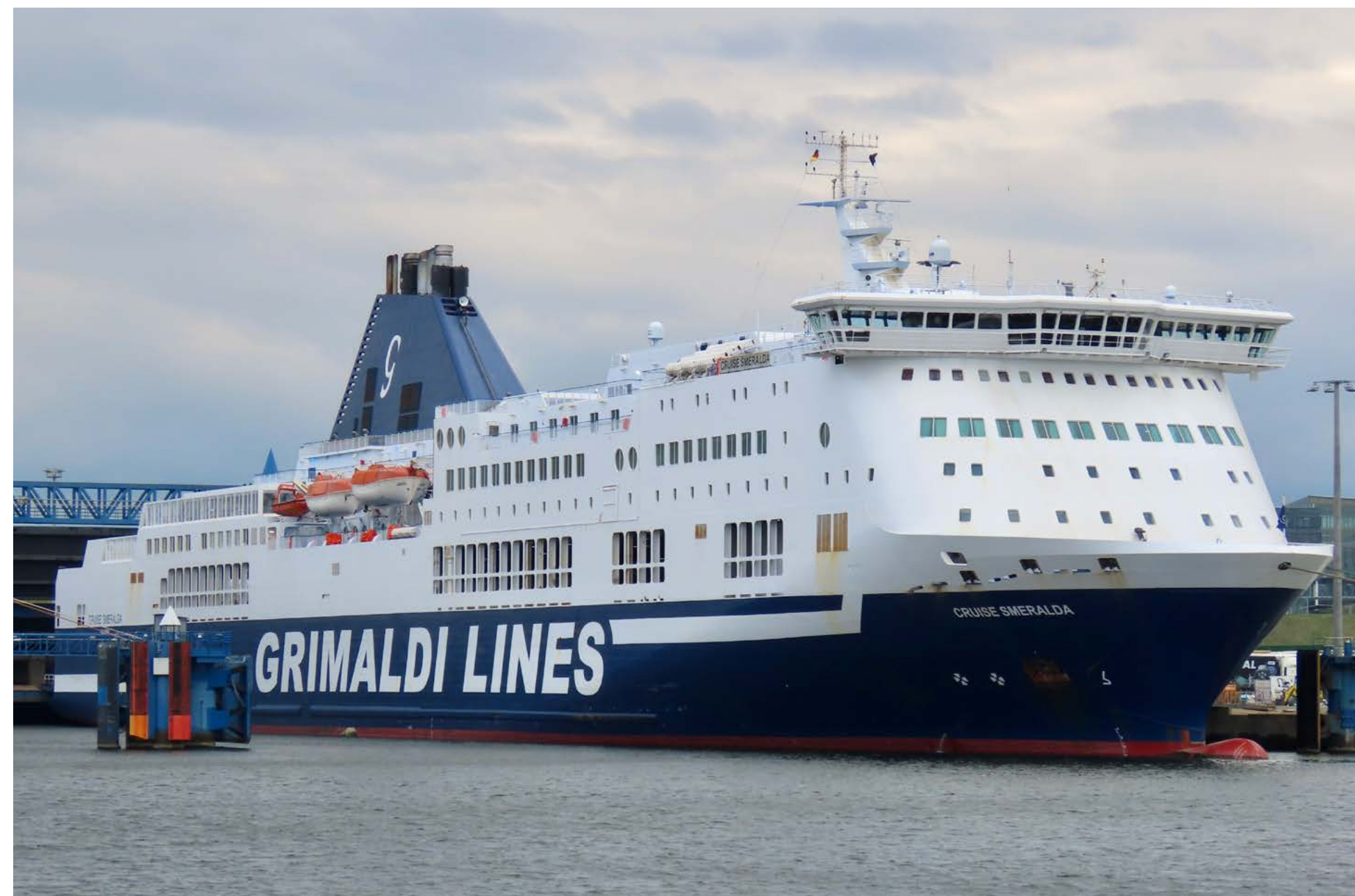
Am 24. April 2023 präsentierte sich CRUISE SMERALDA zum ersten Mal am Travemünder Skandinavienkai. Im Zuge von Werftvertretungen für FINNPARTNER und FINNTRADER verkehrt sie auf der Route Travemünde - Malmö und übernimmt vorerst die Nachtfahrten ab Travemünde.