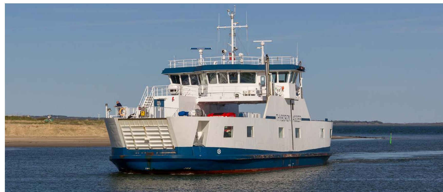
Die KANALEN überbrückt die Öffnung des Limfjords zur Nordsee. Fällt sie aus, bleibt nur der Umweg um den Nissum Bredning, den westlichen Teil des Limfjords, herum.