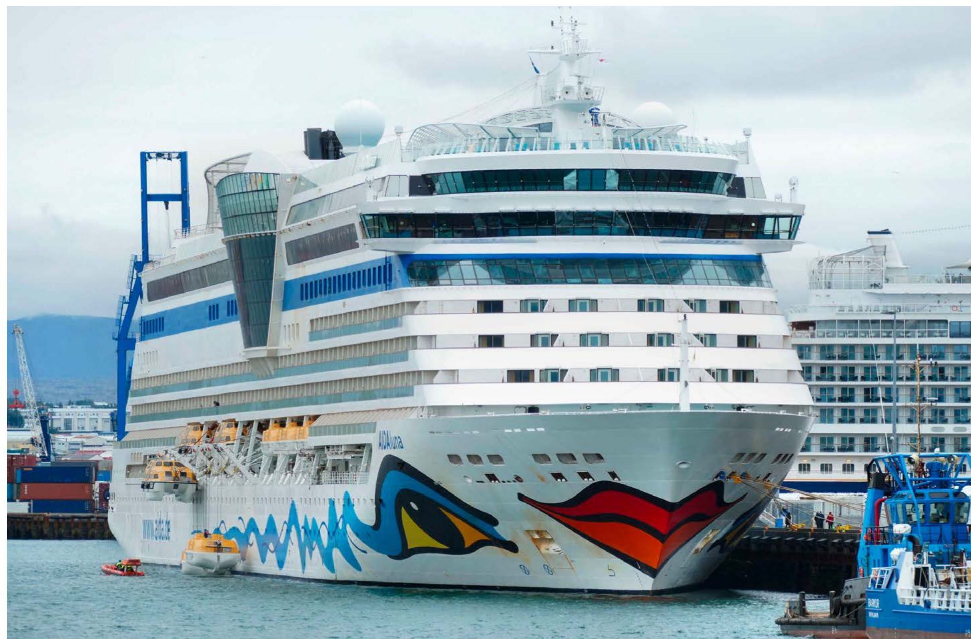
Die AIDALUNA war am 15. Juli in Reykjavik zu Gast. Die ebenfalls anwesende SPIRIT OF DISCOVERY lag fototechnisch ungünstig am Kreuzfahrtskai, wie auch schon die NATIONAL GEOGRAPHIC ENDURANCE am Tag zuvor.