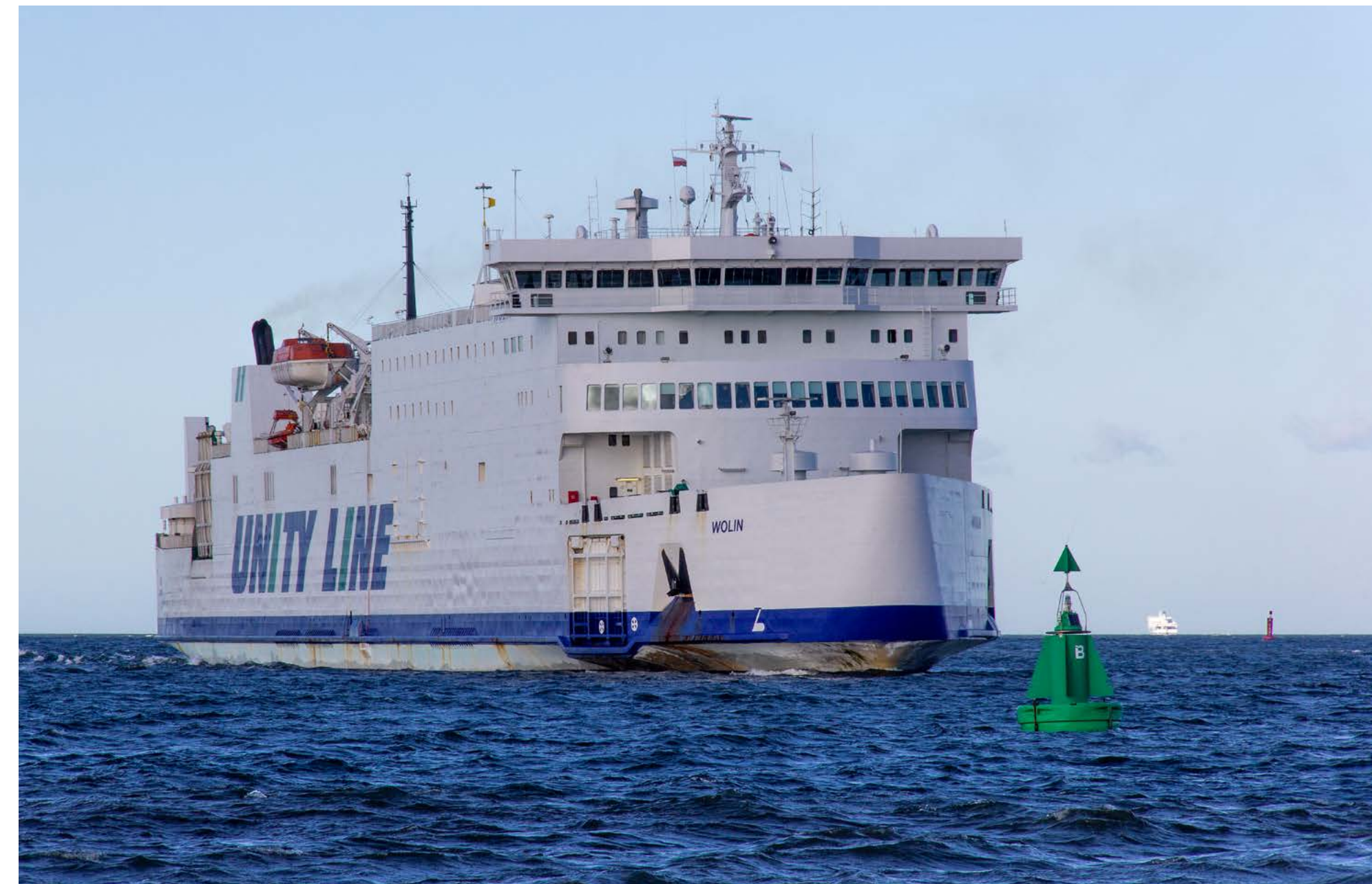
Nur eine Stunde später erreicht die WOLIN den polnischen Hafen. Die Sonne hat sich leider hinter einer kleinen Wolke versteckt.