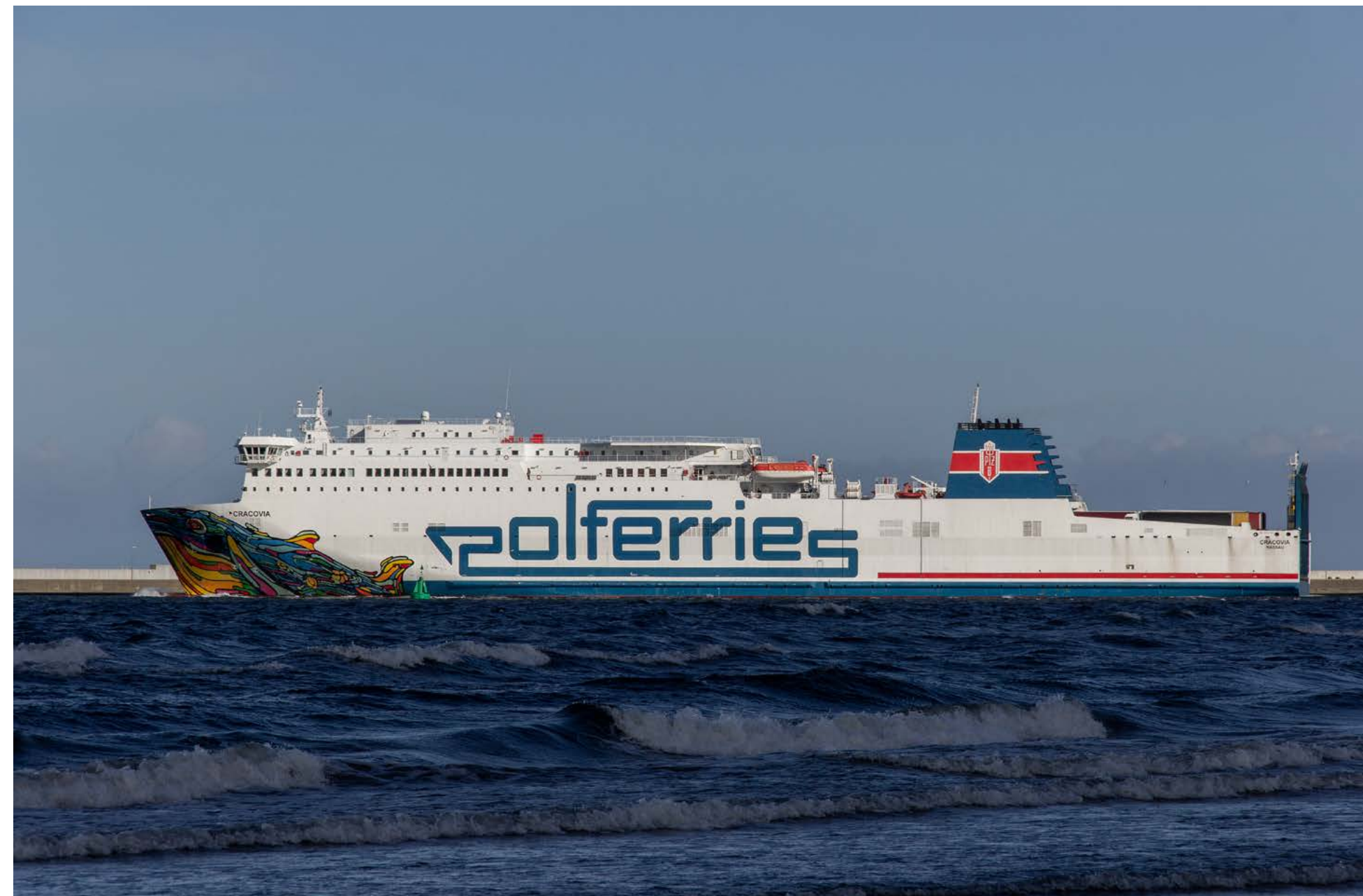
Bei strahlender Nachmittagssonne verlässt die CRACOVIA am 19. Februar 2023 Świnoujście.