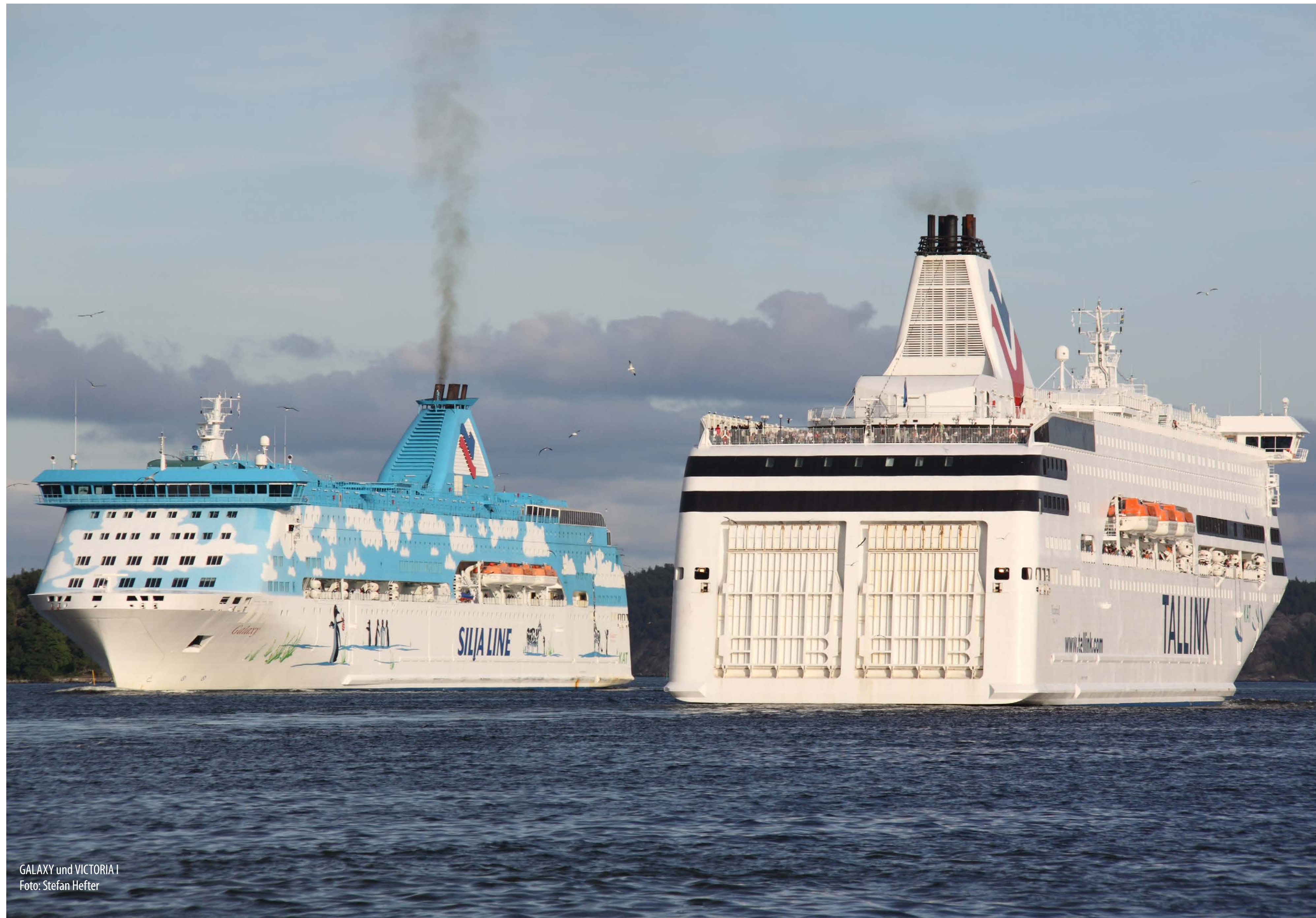
GALAXY und VICTORIA 1